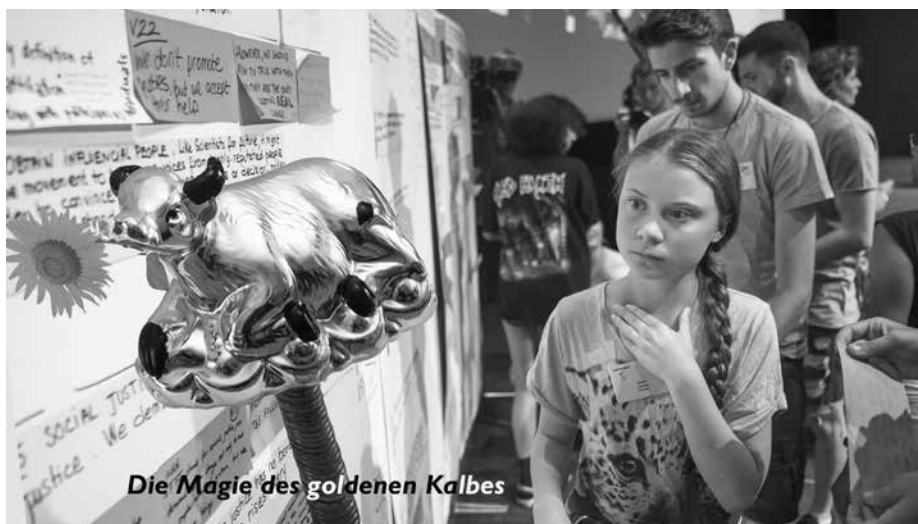
Die Magie des goldenen Kalbes

2011 bis 2018 Vorsitzender des FSB, seit 2008 Direktor der Bank of Canada und ist seit 1. Juli 2013 Gouverneur der Bank of England.